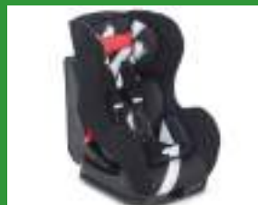
Автокресло группы I для детей массой 9-18 кг