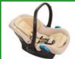
Автокресло группы 0+ для детей массой менее 13 кг